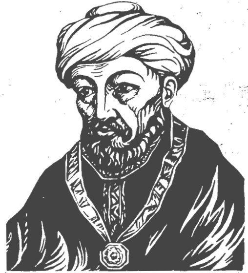
רבינו משה בן מימון

און האָבן זיך באַזעצט אין אַלמקאירא (פּאַסטאַט). אין קאירא האָט זיך דער רמב"ם מפרנס געווען פון דאָס טאָרע. ער האָט פּראַקטיצירט מעדיצין; אָבער ער האָט אויך דעמאָלט ניט אויפגעגעבן די לערע וועגן רעליגיע און פּילאָזאָפֿיע, און האָט פּאַרנעזעצט צו שרייבן זיינע ווערק נאָך אַ שווערן טאָג פון אַרבעט. אין יבן איז ער אַנערקענט געוואָרן אין מצרים אַלס אַ גרויסער דאָקטאָר, און צו דער זעלבער צייט, אַלס דער גרויסער אידישער געלערנטער.