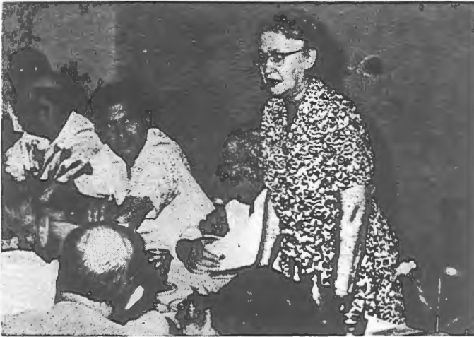
חברה בוויסאן באגריסט די הסתדרות פון ירושלים אין נאמען פון דער דעלעגאציע

האָבן מיר פאַרנומען די הייזער, צו פיר אין אַ הויז, און זיך באַזעצט אין זיי. אַלצדינג אין די הייזער איז געווען נאָנץ און אומגעשטערט, גלייך ווי די מענטשן פון די הייזער זיינען ערשט אַרויסגעגאַנגען פון זיי און וועלן זיך באַלד צוריק אומקערן. נאכדעם ווי מיר האָבן זיך אַרומגעוואָשן און געביטן אונז זענען קליידער זיינען מיר געגאַנגען באַקוקן דאָס דאָרף און דעם טאָל. עס איז אַ שיינער טאָל, ווי אַ גן ערן, און דאָס טיכל איז געלאָפן קלאָר און גיך אין מיטן דאָרף, און קליינע הילצערנע בריקלעך זיינען געווען פאַרוואָרפן איבערן טיכל. אינגאַנצן האָט דער טאָל און דאָס טיכל און די ריינע דאָרפישע הייזער אויסגע- קוקט ווי אַ בילד וואָס אַ מאַלער מאַלט אַמאָל פון אַ שטיקל, באַ- האַלטענעם טאָל אין די בערג וואָס מענטשן גארן צו קומען אַהין און צו געפינען רו און שלום.