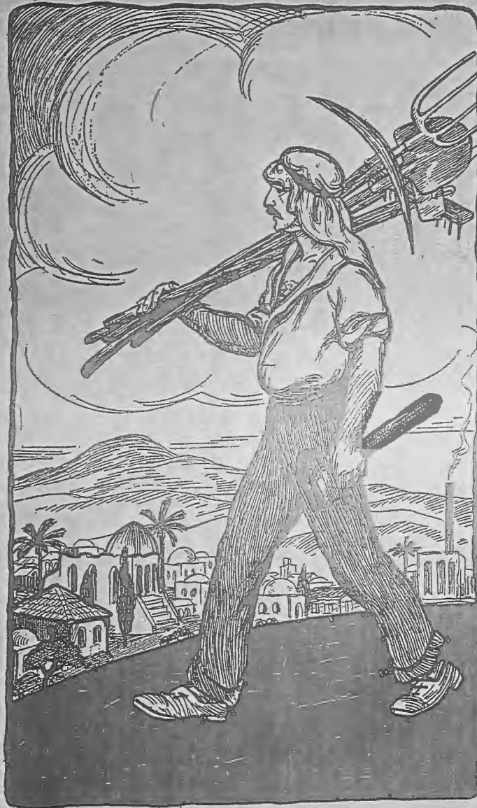
The Builder of the Nation!

The Annual Celebration of the Third Seder Sunday Evening, April 24, 1932 And the beginning of the Campaign for the Jewish Workers' Organizations in Palestine.